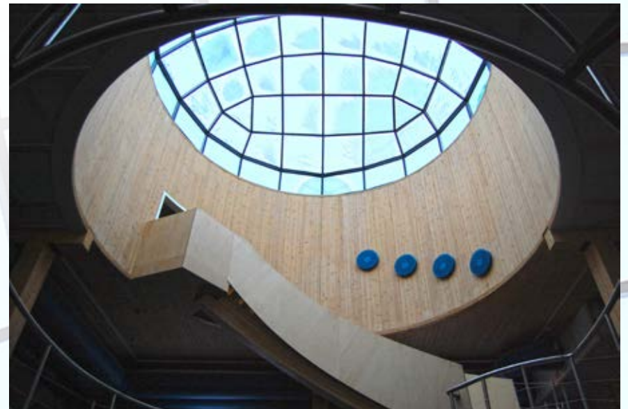
Kupoli on Isonkyrön taidenäyttö!