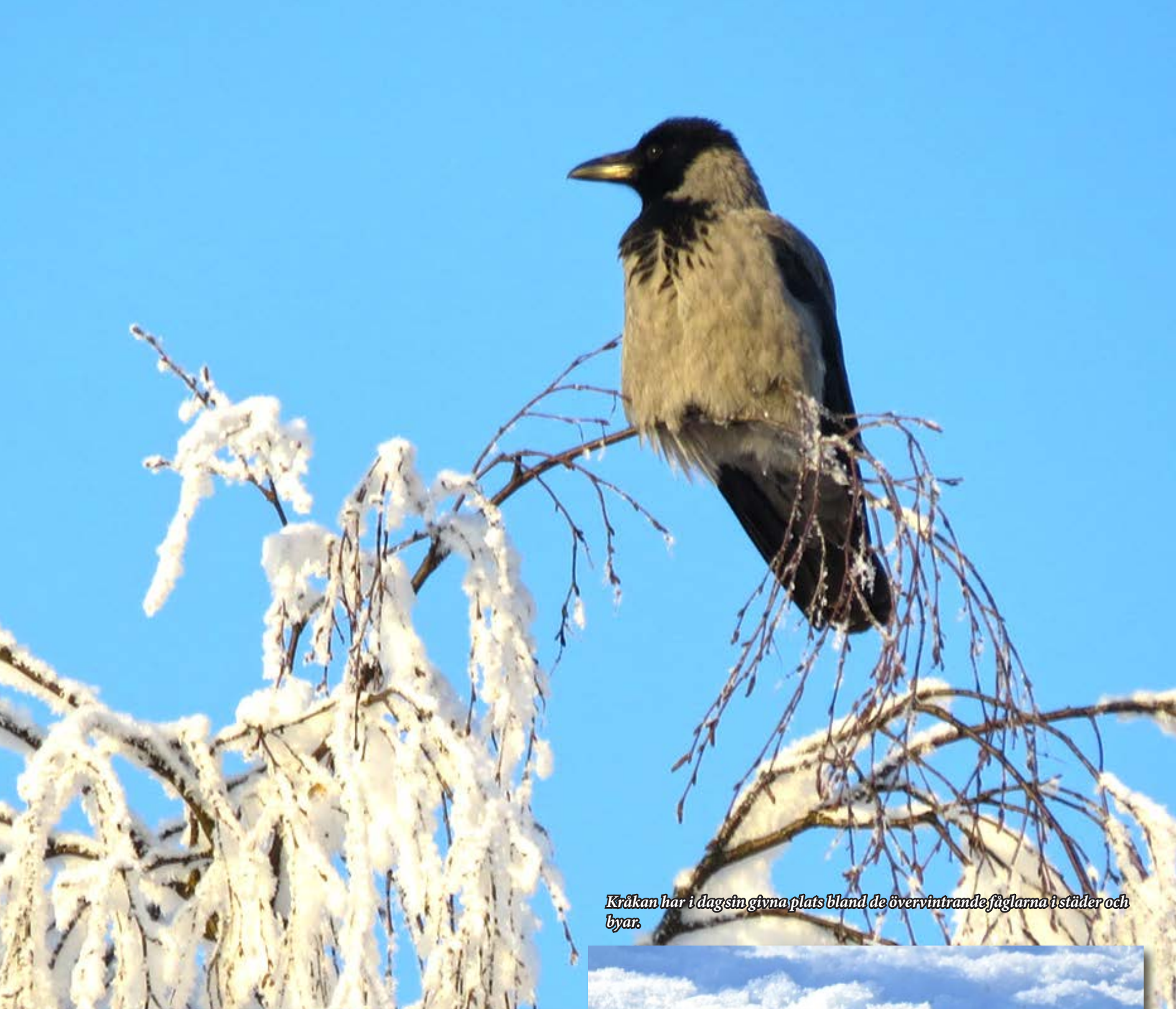
Kråkan har i dagsin givena plats bland de övervintrande fåglarna i städer och byar.