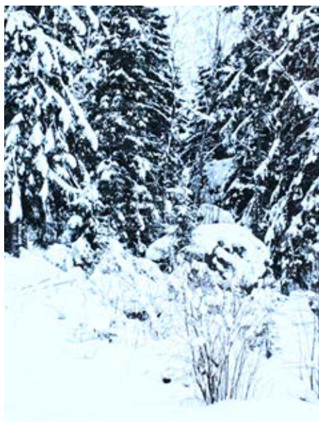
▲ Snörök vinterdag!

Sänd bilden och texten per mejl till mega@upc.fi märkt "Observateur". För varje publicerat bidrag genereras 1 poäng vilket motsvarar 1 euro. När 10 poäng samlats, får man ett presentkort värt 10 euro till Bock's bybutik.