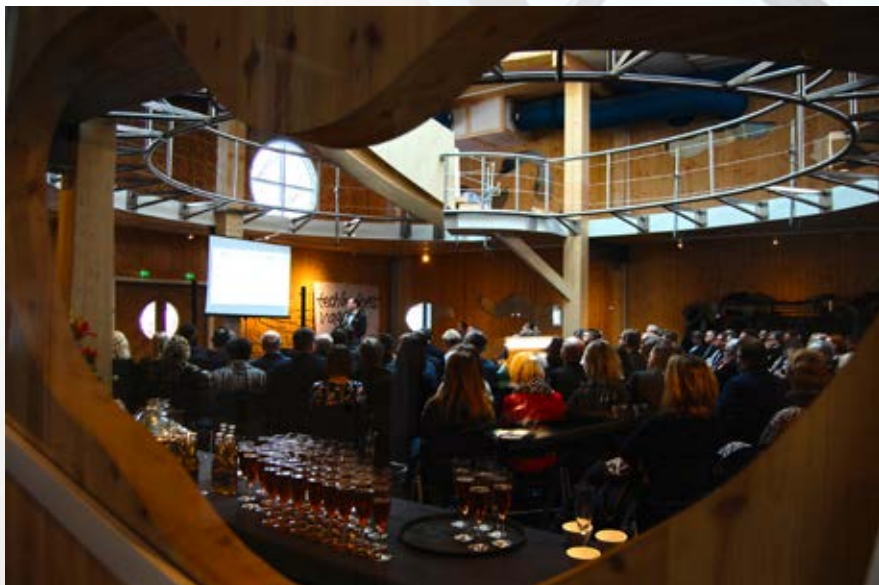
Här klår vi världen I koncept och innovation!