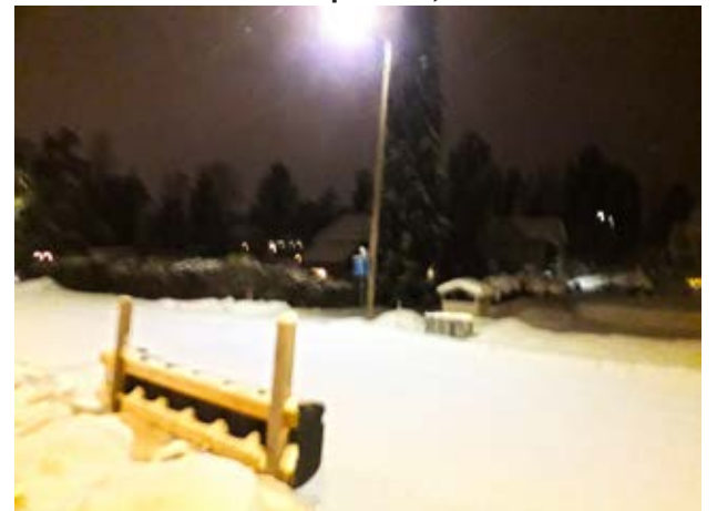
Observateur: Pasi Haapa-Aho, Vaasa