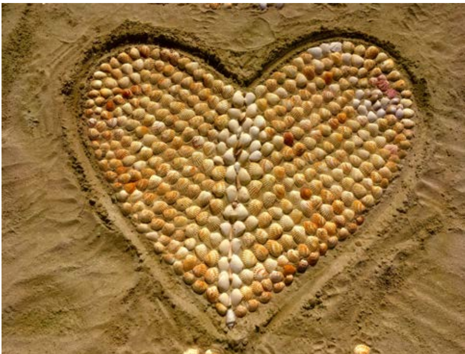
◀ Den 14.02 var det Alla hjärtans dag. Bilden är tagen på en sandstrand en bit utanför Dubai.