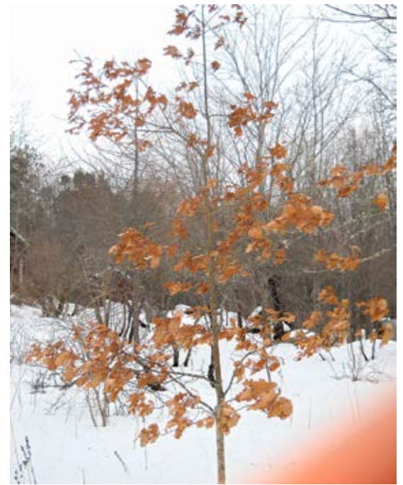
▲ "Nuori tammi helmikuun asussa Yxgård puutarhassa Vanhassa Vaasassa"