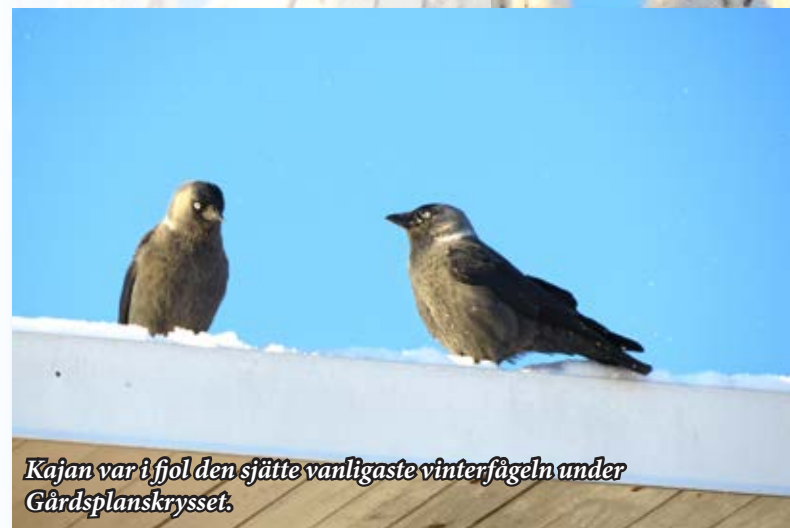
Kajan var i fjol den sjätte vanligaste vinterfågeln under Gårdsplanskrysset.

Vår egen koltrasthanne överlevde inte fram till Gårdsplanskrysset. I fjol klarade sig han bra genom hela vintern. Det visar tydligt, vilken avgörande betydelse vinterfågelmattningen har för småfågellarna, speciellt för en övervintrande sydlänning som inte skulle klara sig ute i naturens bistra vintertillvaro. Veckan före Gårdsplanskrysset flög koltrasthannen med fart i fönstret och skadade sig, förmodligen skrämmd av sparvhöken som brukar hälsa på ibland. Den kalla natten tillbringade koltrasten sovande i röda vinbärsbusken, där skatorna hittade honom på morgonen och befriade honom från hans plågor.