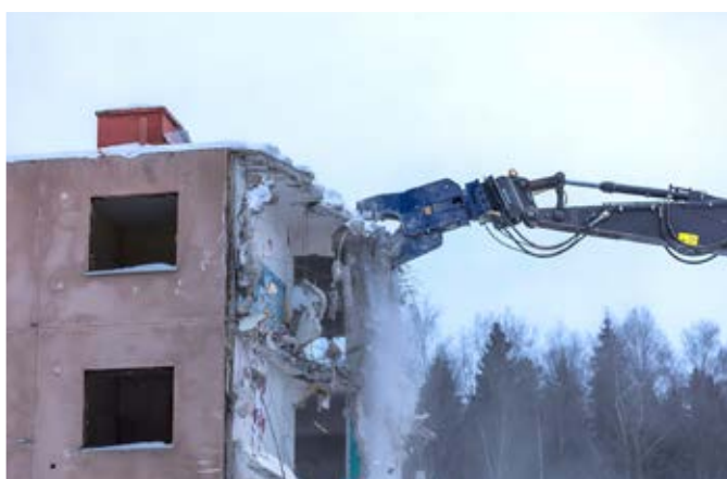
"Masken kerrostalon purkua Pietarsaareissa 14.02.2019."