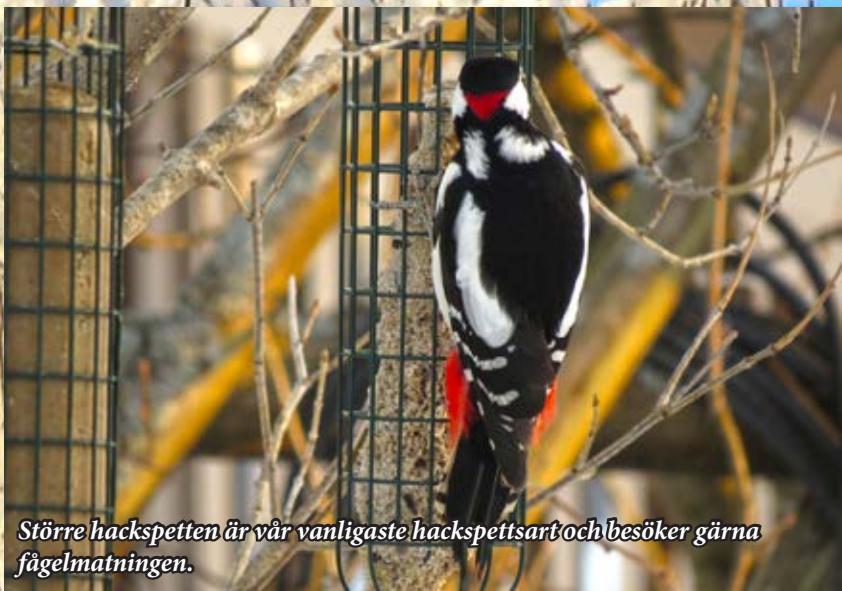
Större hackspetten är vår vanligaste hackspettsart och besöker gärna fågelmatningen.