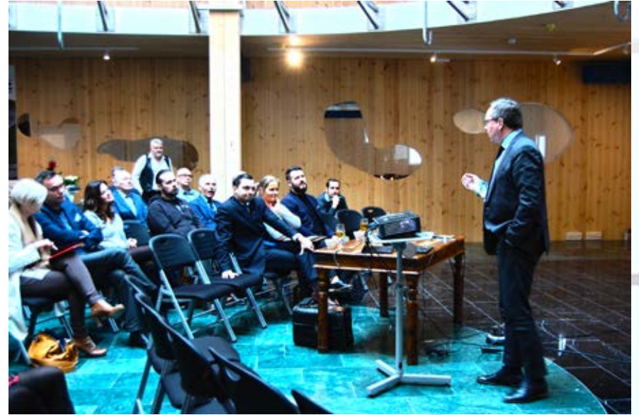
Ministeri Lintilä innostuneesti mukana