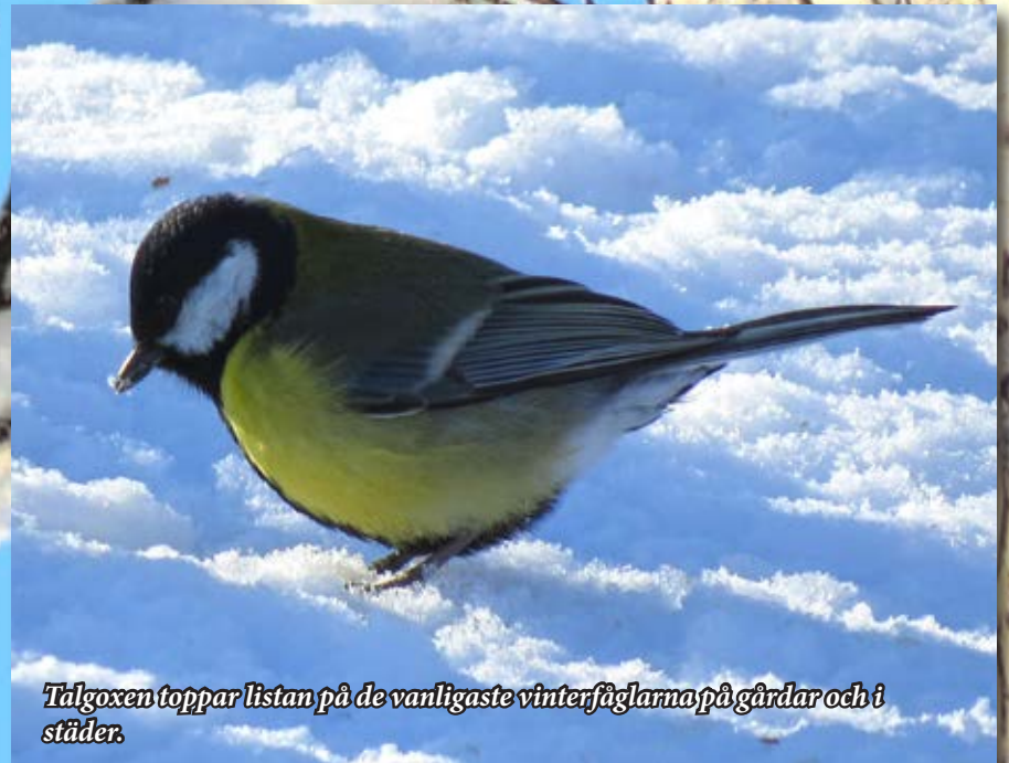
Tålgoxen toppar listan på de vanligaste vinterfåglarna på gårdar och i städer.