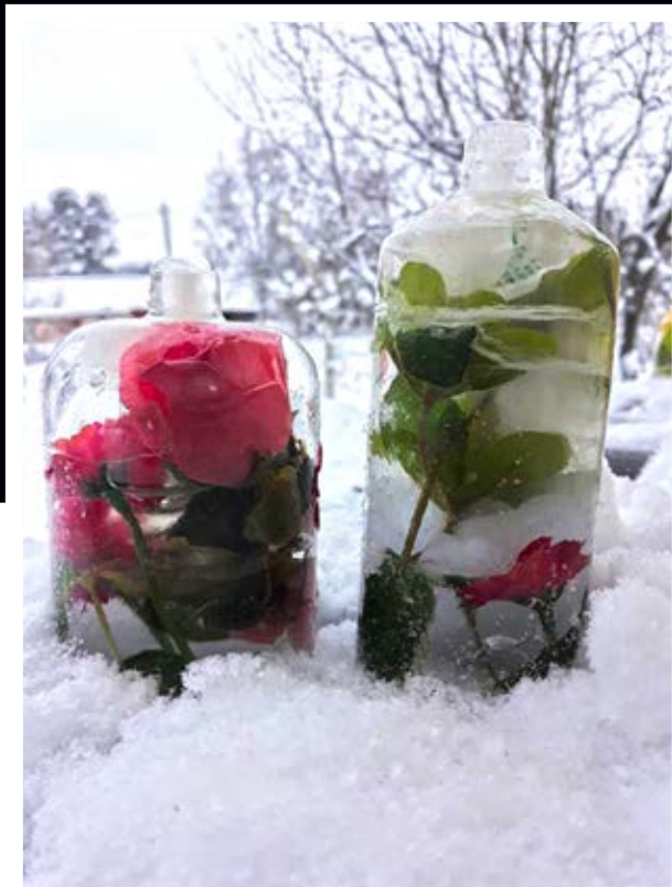
Elisabeth Holm, Kvimo.

Vi publicerar varena vecka våra läsares bilder i digialbumet. Du kan delta via e-post. Skicka in bilden till mega@upc.fi med namn och ort.