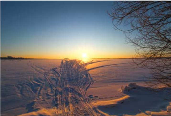
Niklas Falk. "En soluppgång över Södra Stadsfjärden i Vasa 27 Januari 2019."