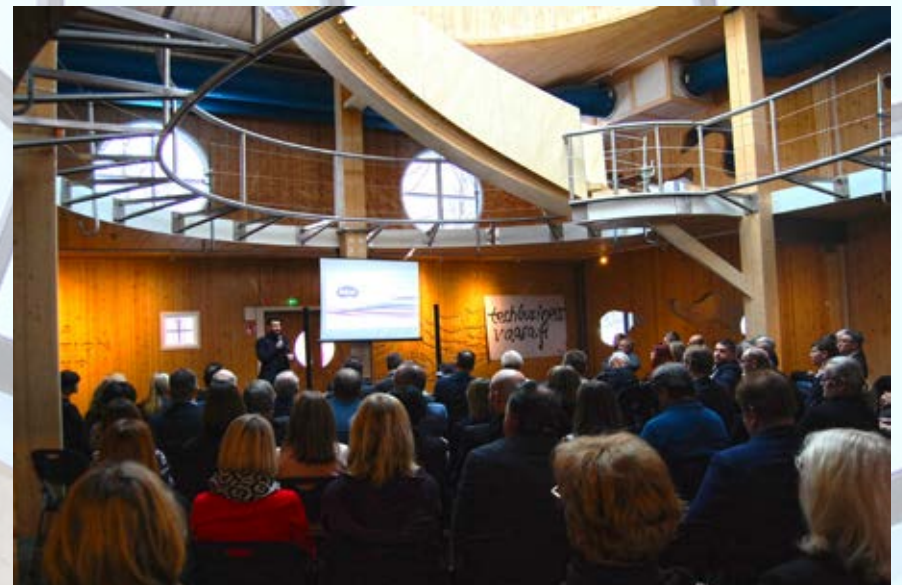
Ordentlig uppslutning. Viexpo visar väg.