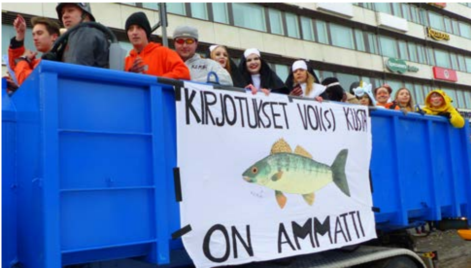
◀ "Abien penkkariajelu pilvisessä säässä, 14.2.2019 Vaasa". "Kirjotukset voi(s) kusta, kuha on ammatti."