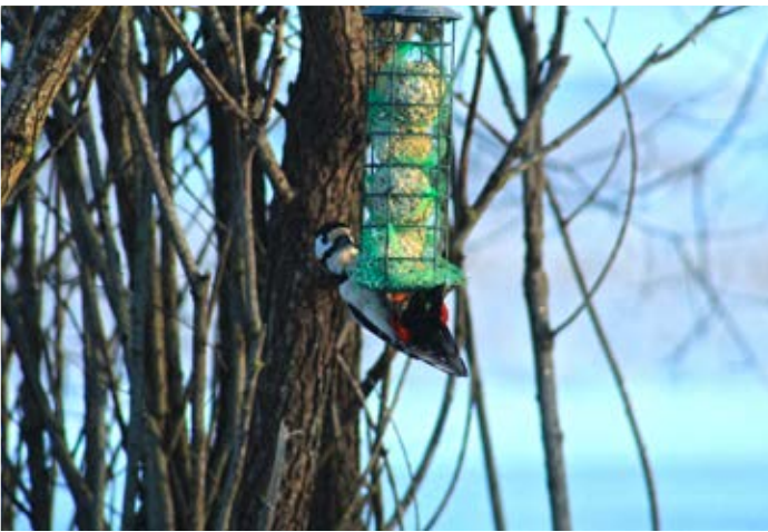
Samuli Tyynismaa, Vaasa. "Käpytikka tykkää myös talipalloista."