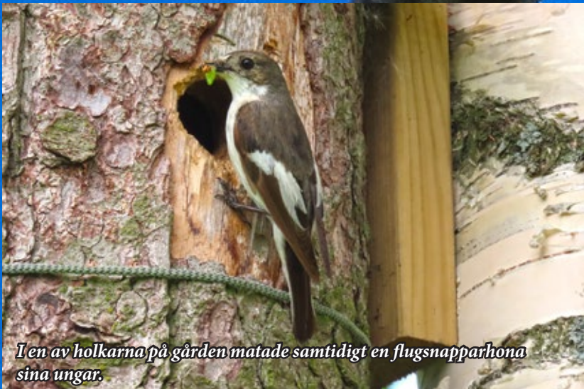
I en av holkarna på gården matade samtidigt en flugsnapparen sina ungar.