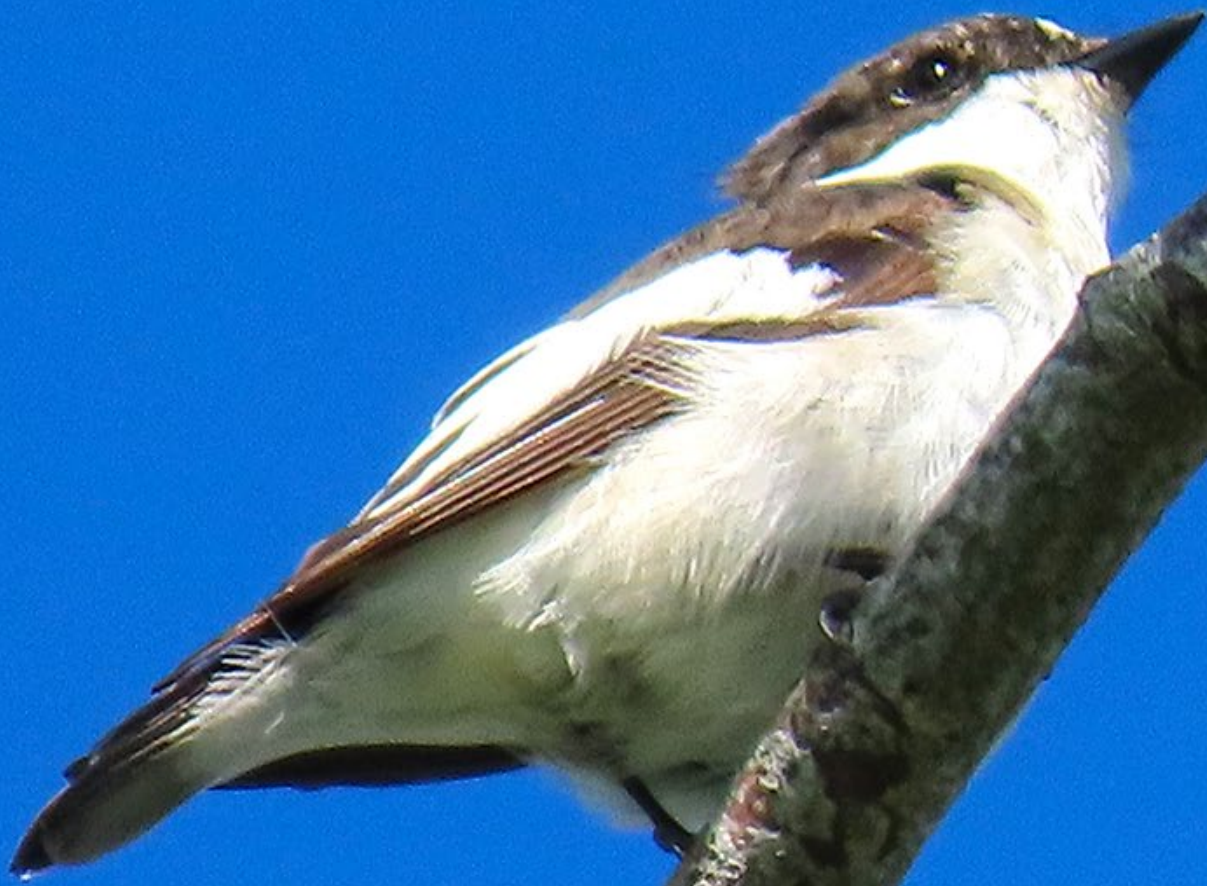
Den märkligt sjungande flugsnapparen i Kalax.