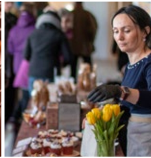
Bakery By Alena