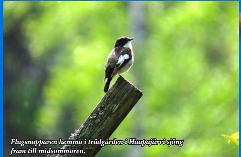
Flugsnapparen hemma i trädgården i Haapajärvi sjöng fram till midsommaren.