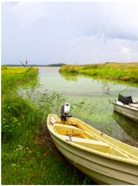
Anette Wikberg, Träskvik. "Hinjärv Träsk".

Vi publicerar varena vecka våra läsares bilder i digialbumet. Du kan delta via e-post. Skicka in bilden till mega@upc.fi med namn och ort.