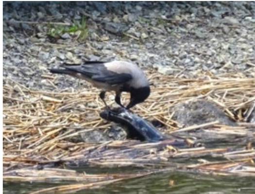
Tuula Taskinen, Vaasa. "Noutopöytä".