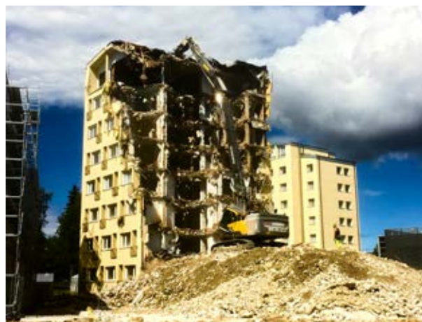
Christian Nylund, Vasa. "Idag 13.06 rivs det gamla I-huset vid Vasa centralsjukhusområde".

Vi publicerar varena vecka våra läsaes bilder i digialbumet. Du kan delta via e-post. Skicka in bilden till mega@upc.fi med namn och ort.