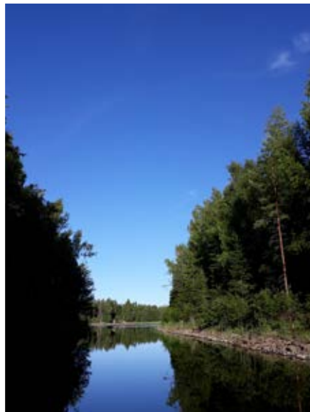
Terese Wik. "Vacker junikväll..."