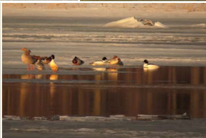
I det större strömdraget har gäss, änder och skrakar gått upp på iskanten för att vila.