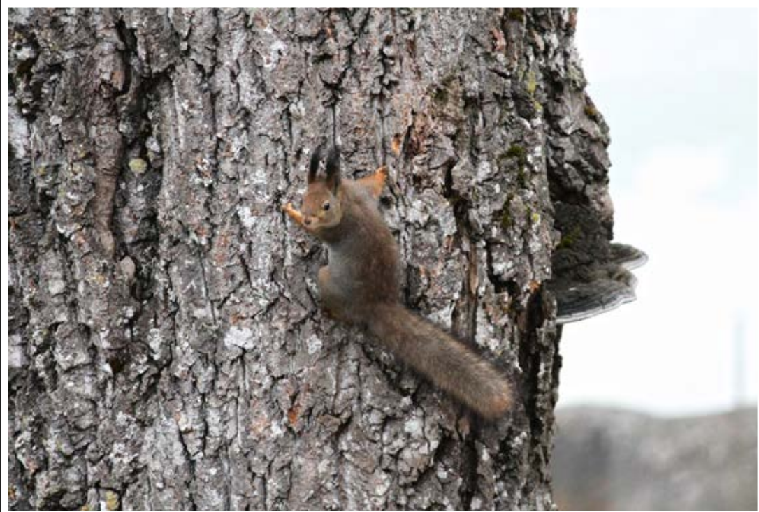
Toivo Salminen. "Kurre aamujumpalla Petsmossa".