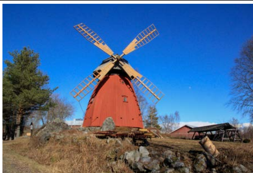
Niklas Falk. "Vårbild från Sundom 25 April 2018".