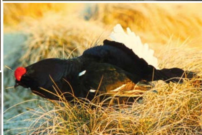
Än kan man lyssna till orrarnas bubblande spel i skärgården.