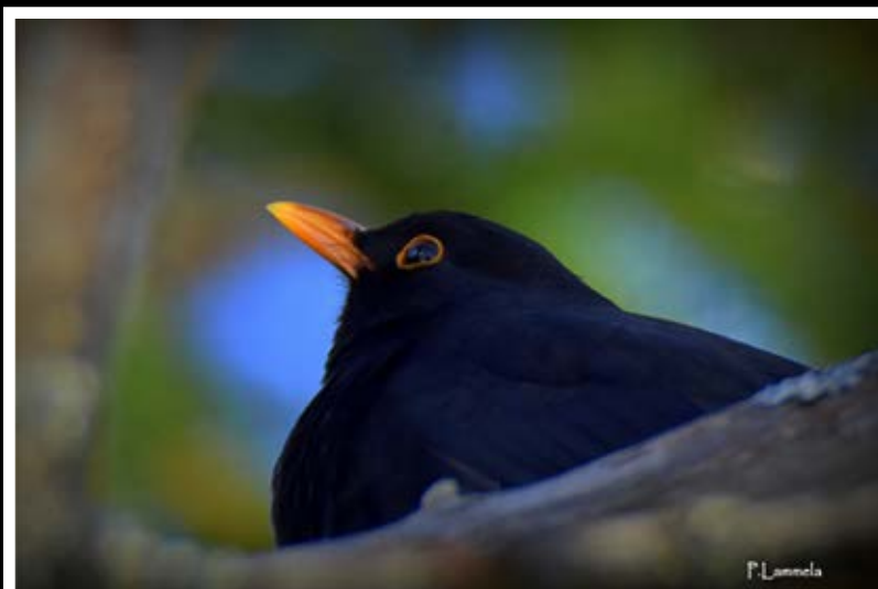
Päivi Lammela, Teuva. "Mustarastas".