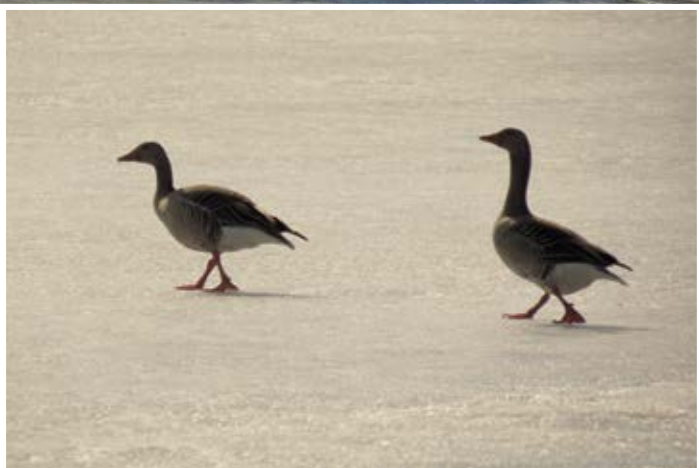
Grågåsparet går ut på sundets is, medan jag vandrar förbi.