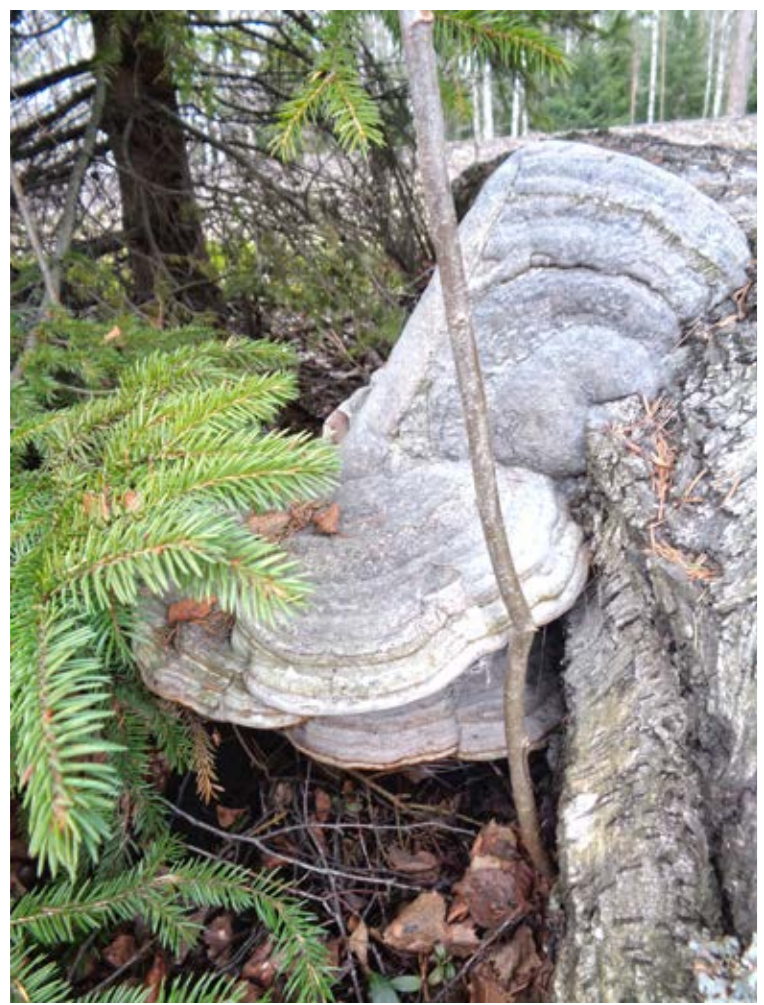
Tuula taskinen, vaasa. "Jättiläis" käävä".