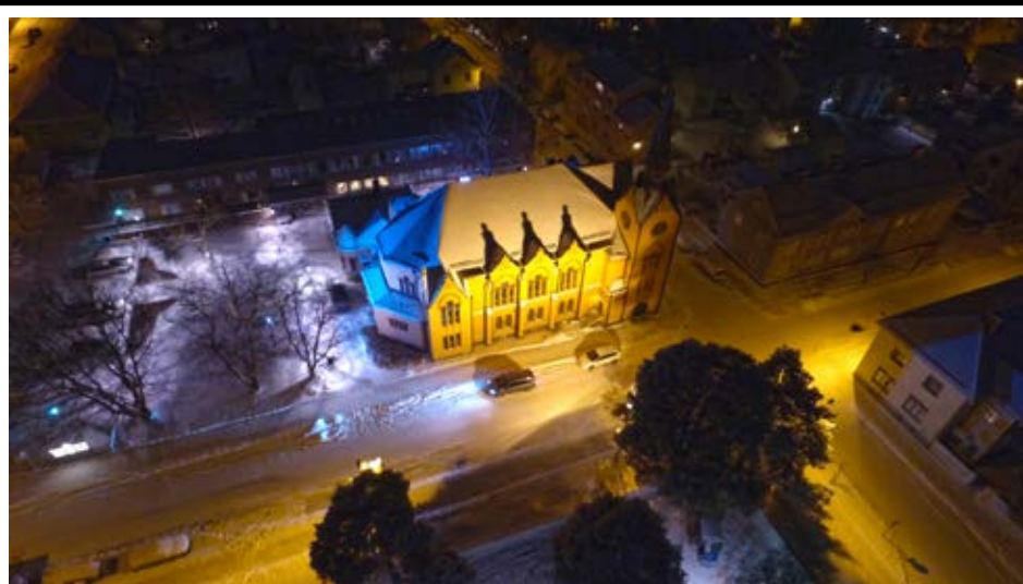
Tom Sjöholm. "Palosaaren kirkko".