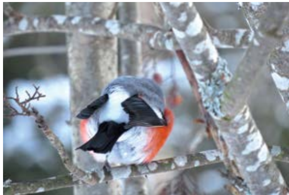
Domherrens svarta ving- och stjärtpenor ramar in den vita övergumpen.