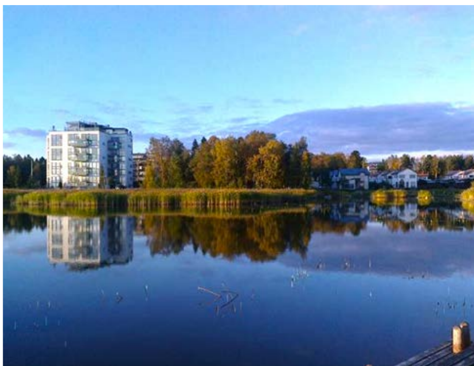
Barbro Kuokkanen, Vaasa. "Kuvattu Suvilahden asuntoalueen sillalta".

Vi publicerar varena vecka våra läsares bilder i digialbumet. Du kan delta via e-post. Skicka in bilden till mega@upc.fi med namn och ort.