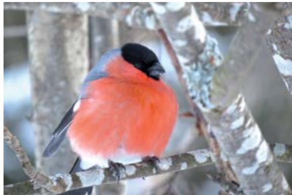
Rundbröstad och färggrann sitter den ensamma domherren i en rönn intill parkeringen.