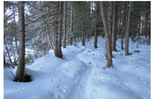
I den grandominerad skogen är snötäcket mönstrat av spår från harar, ekorrar och smågnagare.

M olnig vinterdag med en handfull minusgrader och stillastående luft. Några snöflingor dalar sakta ner från den helmulna himlen, när vi kliver ur bilen för en vandring genom den fredade granskogen vid ån. Av de öppna strömställena syns inget efter en månad med normalsträng vinterköld, men snötäcket på den tillfrusna ån och inne i skogen är mönstrat av skogsharens och fältharens hoppspår, av räv, katt och ekorre, och inte minst av sork, möss och näbbmöss som varit uppe på snön och sprungit från gömställe till gömställe i dunkla vinternätter.