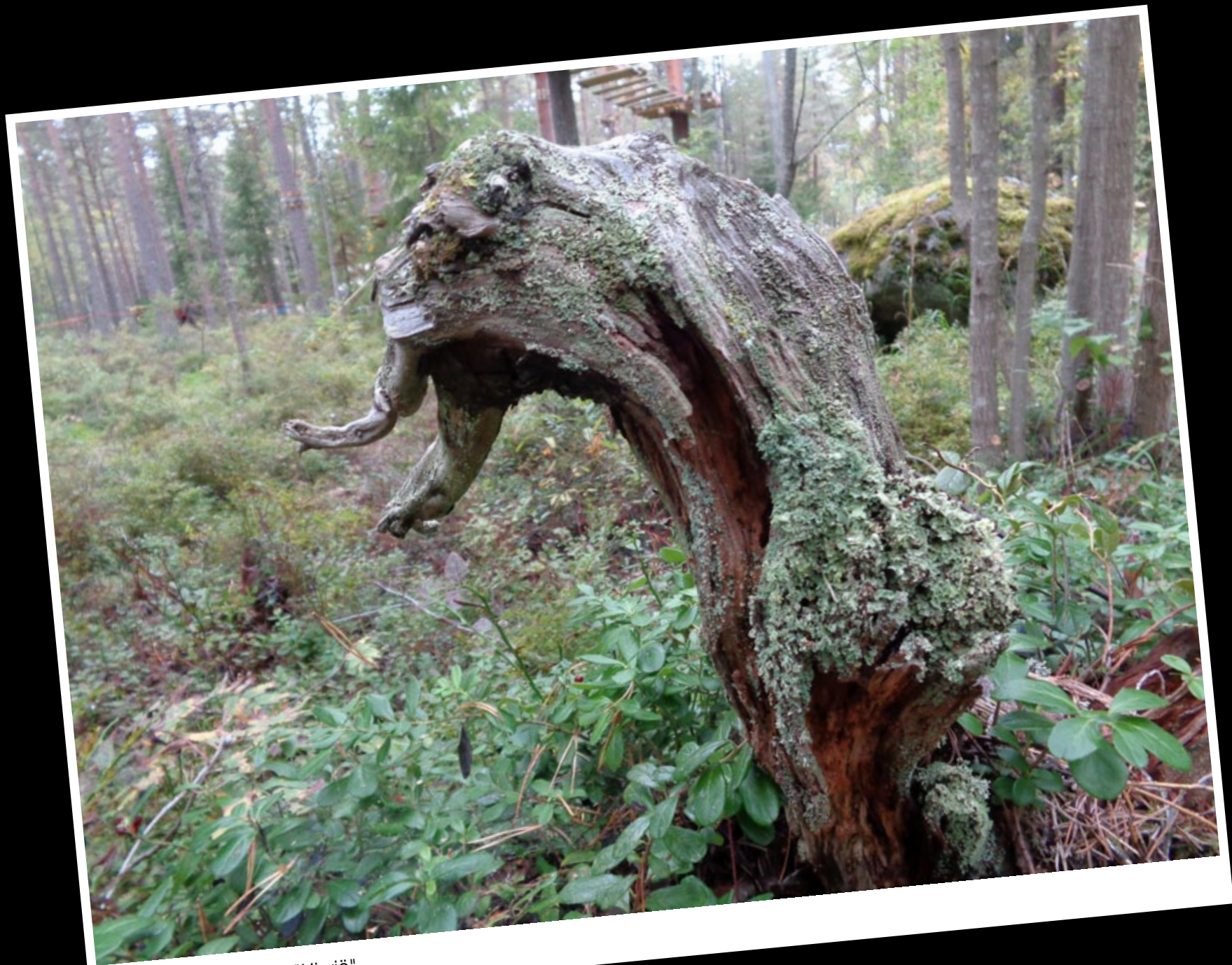
Tuula Taskinen, Vaasa. "Hirviö"