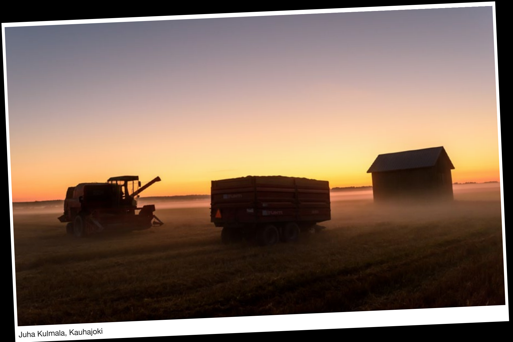
Juha Kulmala, Kauhajoki

Vi publicerar varena vecka våra läsaes bilder i digialbumet. Du kan delta via e-post. Skicka in bilden till mega@upc.fi med namn och ort.