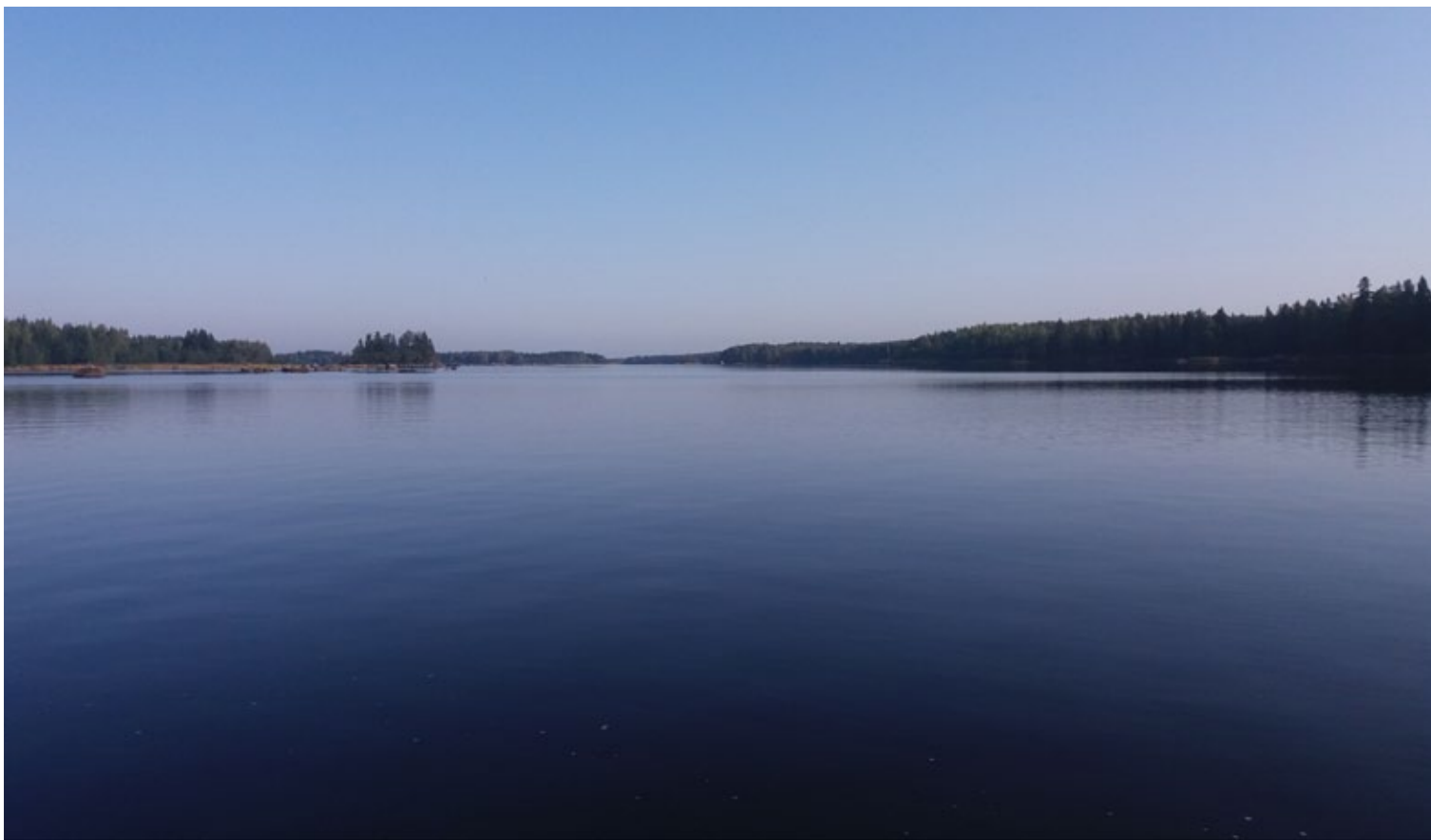
Terese Wik, Djupsund. "Spegelblankt..."