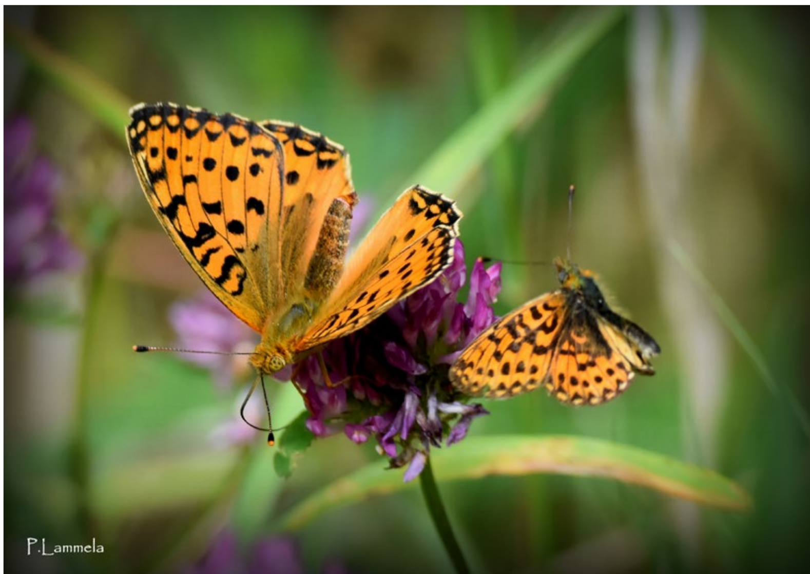
Päivi Lammela, Teuva