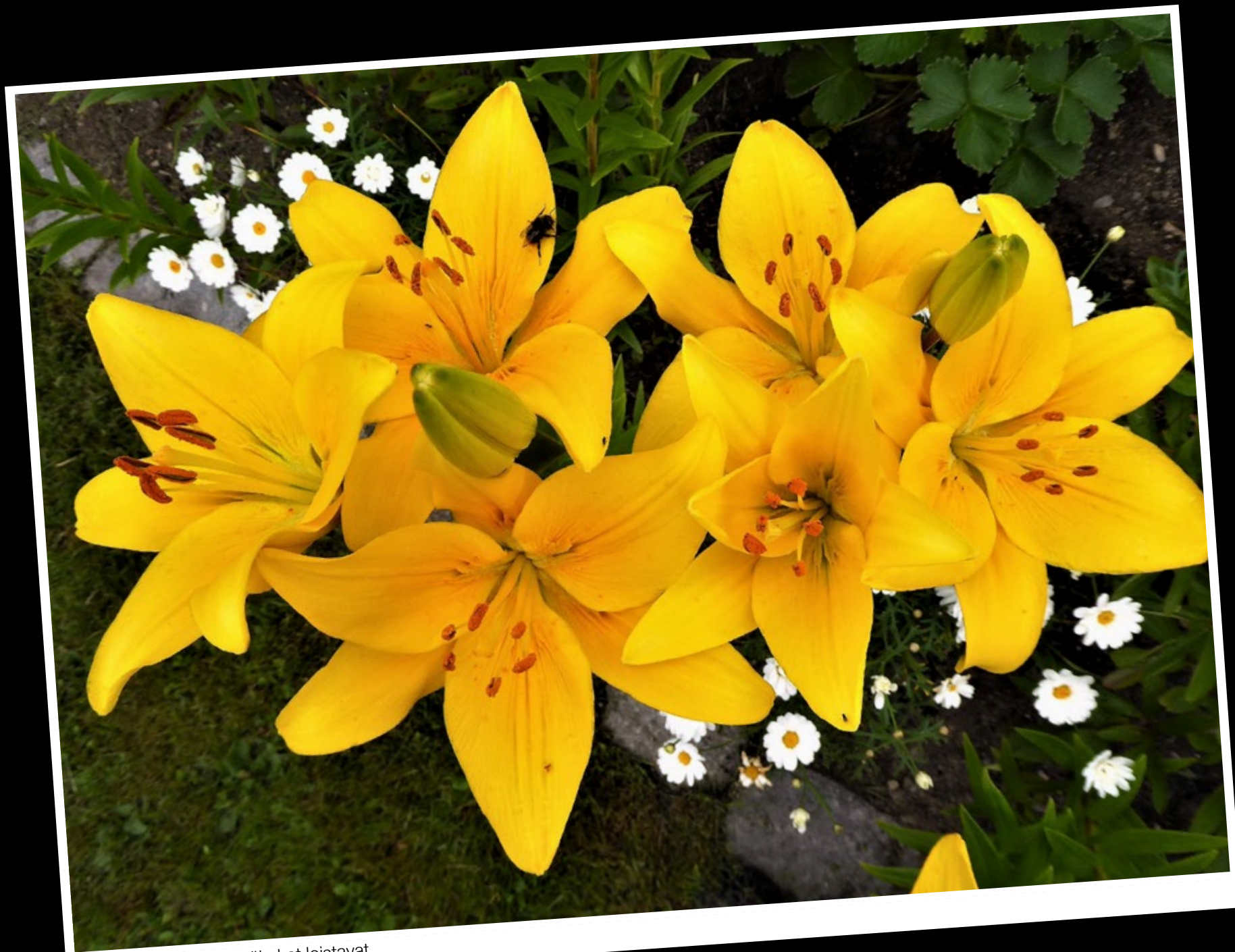
Esa Rönkä Vaasa. Kesäkukat loistavat.

Vi publicerar varena vecka våra läsaes bilder i digialbumet. Du kan delta via e-post. Skicka in bilden till mega@upc.fi med namn och ort.