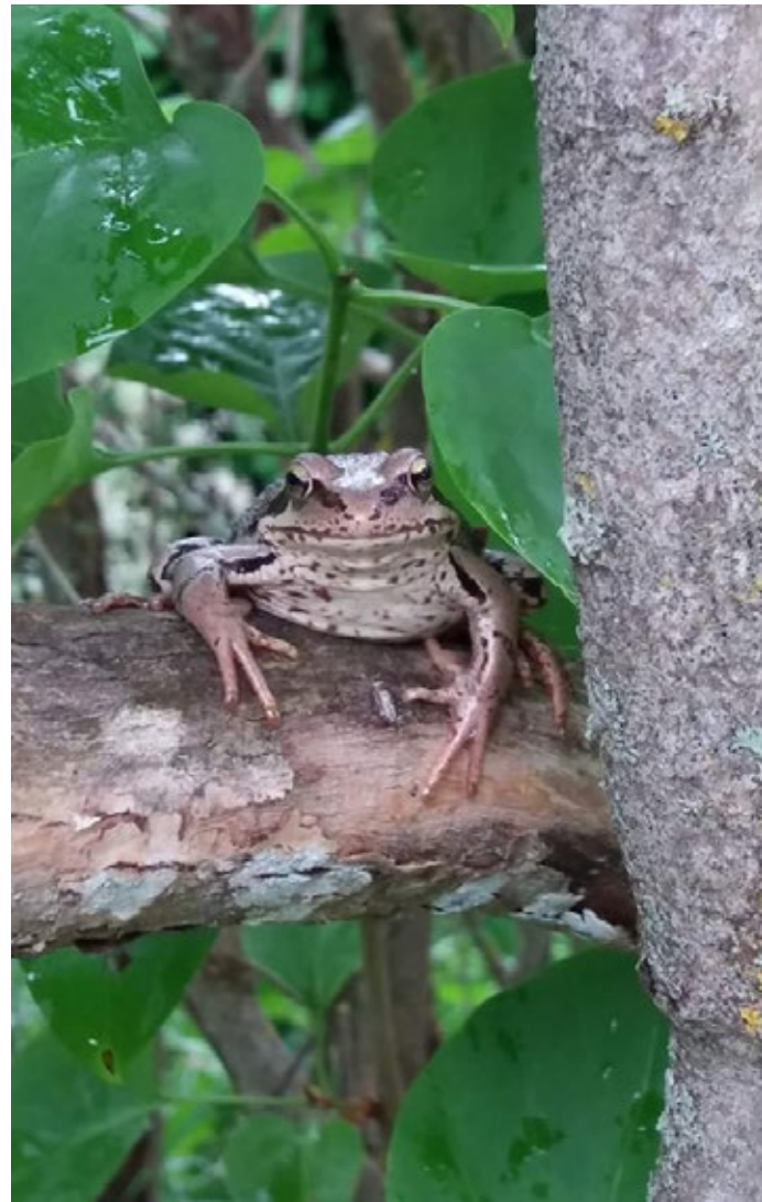
Gunvor Foxell, Korsholm. Groda 1,5m upp i syrenbusken