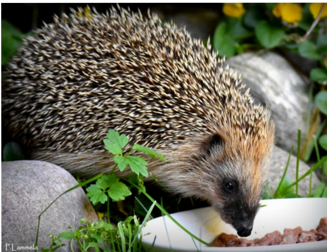
Päivi Lammela, Teuva