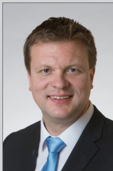
Ville Skinnari Kansanedustaja/riksdagsman